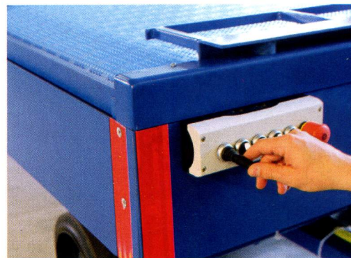
3: Über das Bedientableau an der Stirnseite des Wagens steuert der Bediener alle Bewegungsabläufe

Auch diese sicherheitsgerichteten Fahrbewegungen werden hydraulisch ausgeführt,