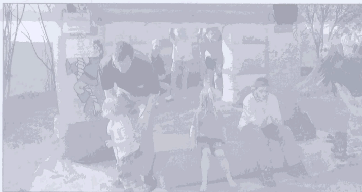
Die Hüpfburg war für die Kleinen der größte Anziehungspunkt.

Mit ganz neuen und auch bewährten Tänzen erfreute die Tanzgruppe des DRK Ortsvereins Hachmühlen unter der bewährten Leitung von Ursula Person. Die Tänzerinnen ernteten für ih-